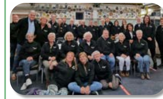
Een groot deel van ons huidige team kringloopkanjers

Ons huidige team bestaat uit 58 medewerkers.